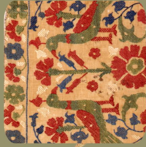
Συλλογές: Σχέδια, Σχήματα, Χρώματα

...ρόγραμμα «Συλλέγω, ερευνώ, εκθέτω...» ...ώμονα τη νέα μόνιμη έκθεση του ΠΛΙ «Συλλογές: ...ρο και στον χρόνο», που στοχεύει στην ανάδειξη ...λλογών του. Είναι μία δράση που ξεκινά με ...σειό, συνεχίζεται στην τάξη και ολοκληρώνεται στο ...οντας την αλληλεπίδραση των μαθητών με αυτό και ...ς σταθερής σχέσης μεταξύ τους.