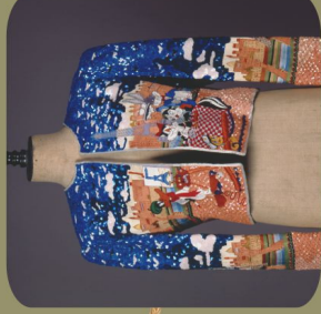
"Συλλέγω, ερευνώ, εκθέτω..."