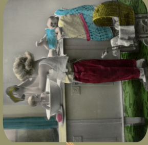
Είμαι ένα μικρό παιχνίδι...