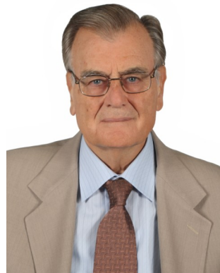
Ο Πρόεδρος της Αρχής, κ. Πέτρος Χριστόφορος, Επίτιμος Σύμβουλος της Επικρατείας

τροποποιείται εκ βάθρων το θεσμικό πλαίσιο για την προστασία των προσωπικών δεδομένων στην Ε. Ένωση. Η Ε. Επιτροπή αναμένεται να ανακοινώσει τις επίσημες προτάσεις της στις 25 Ιανουαρίου. Σύμφωνα με τη μέχρι τώρα ενημέρωση, η Οδηγία 95/46/ΕΚ προτείνεται να αντικατα-